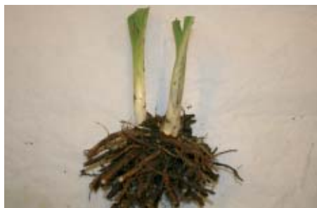
Taglilie, frisch vom Feld, wurzelnackt