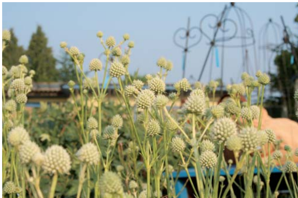
Eryngium yuccifolium (s.S. 157)