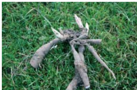
Pflingstrose, frisch vom Feld, wurzelnackt