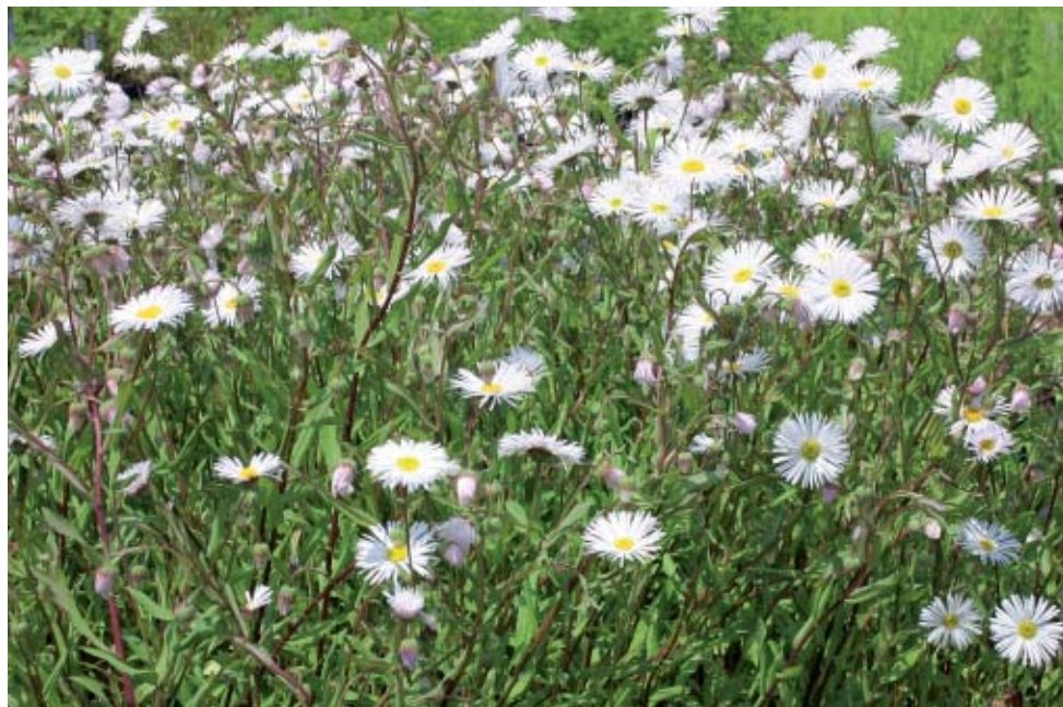
Erigeron cultorum 'Sommerschnee' (s.S. 155)